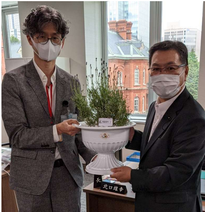
中富良野町からラベンダーをいただく(6月21日)

北口道議は、前半の2年間は議会選出の監査委員を務め、後期は会派の会長に就任しました。